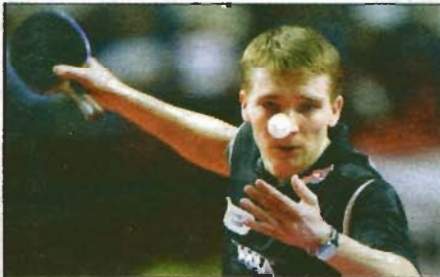
Werner Schlager siegte beim Pro Tour-Turnier in Zagreb. SEITE 46

Bei der Donaubrücke soll ein Kreisverkehr die Kreuzung entschärfen. SEITE 19